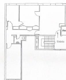
45 rue de LOURMEL - 2 ème étage - Lot n° 7 - 75015 - PARIS